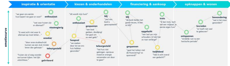
Customer journey map | Starters